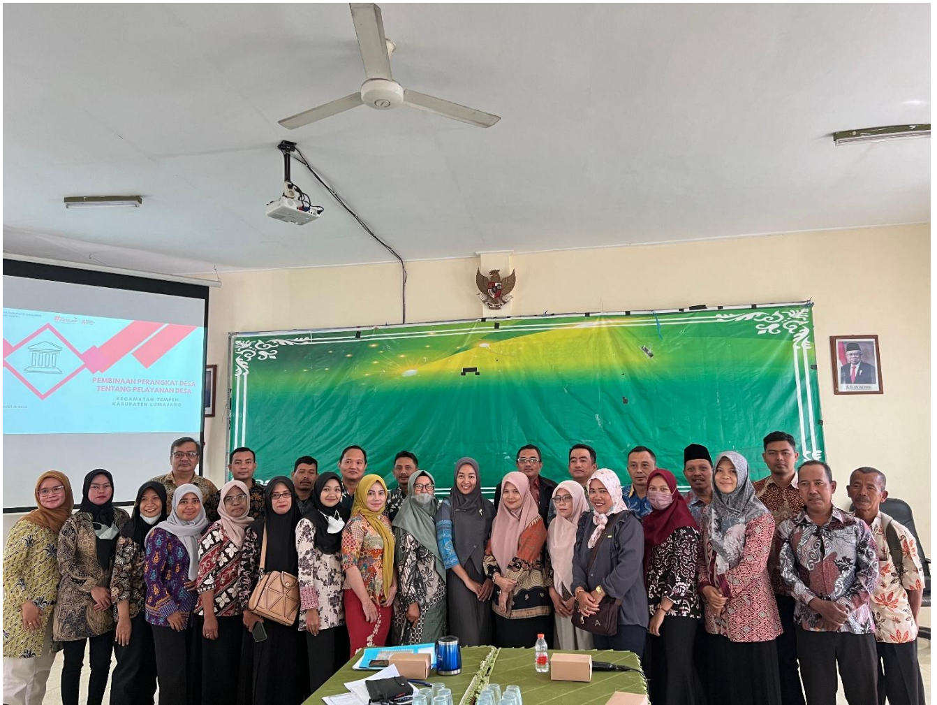
13. Fasilitasi sinkronisasi perencanaan pembangunan Penyusunan RKPDes